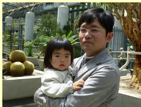
家族と過ごす時間を大切にしています。

当社では、毎月第一月曜日にノー残業デーを導入しました。社員の時間管理に対する意識が生まれ残業時間が減少し、余暇の増加につながっています。また、育児のための短時間勤務制度も利用されており、働く女性の仕事と子育ての両立もはかられています。